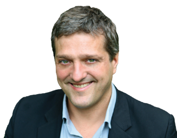
Desarrollado e impartido por Alejandro Lorente

HOTEL NH PRINCIPE DE VERGARA,92 horario 10:30-14:30/16:30-20:00